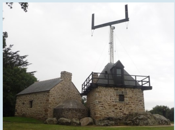
La tour Chappe de Saint Marcan (Ille et Vilaine)