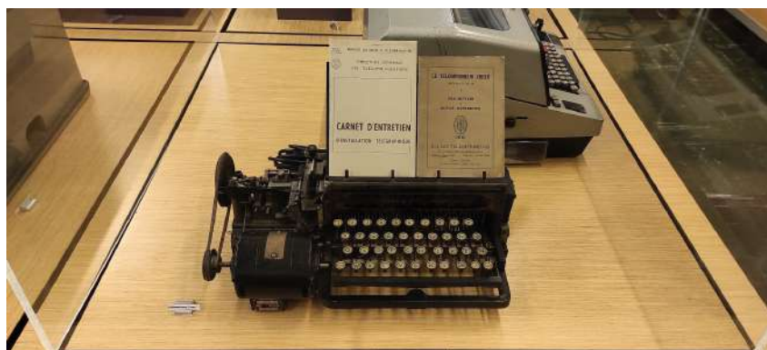
Le téléscripateur Creed

Inventé en 1902 par l'ingénieur anglais Frédérik Creed cet appareil permettait à l'opérateur de transcrire les bandes perforées classiques en caractères alphanumériques. Le clavier, identique à celui d'une machine à écrire, est associé à une perforatrice de bande. Il peut soit commander directement la transmission, soit perforer, soit transmettre et perforer simultanément.