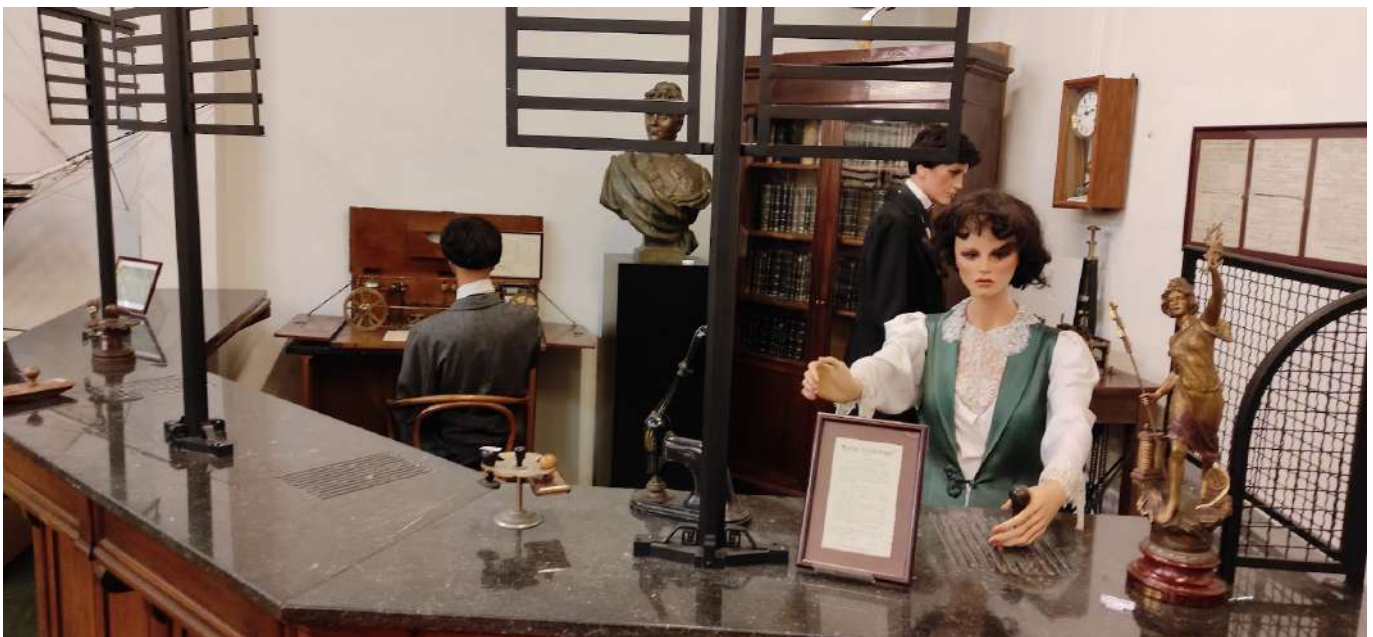
Le guichet de poste de l'époque sera une des pièces majeures

Le guichet de poste de l'époque sera une des pièces majeures permettra de se plonger dans l'ambiance de l'époque de façon tout à fait réaliste..