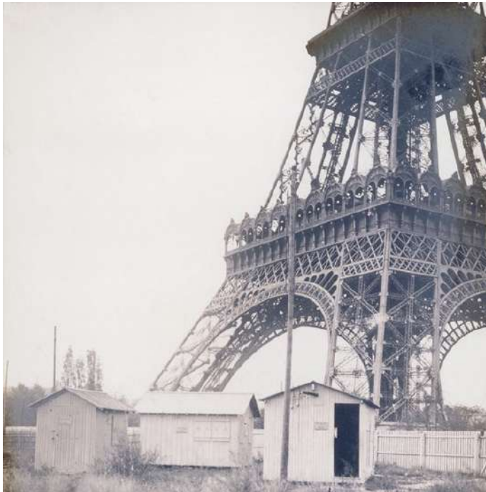
Le premier poste de télégraphie sans fil de la tour Eiffel

(brevet du 15 janvier 1907), un schéma de principe d'un poste récepteur utilisant un audion se trouve dans le nu-