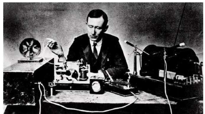
Guglielmo Marconi devant son équipement en 1901. technologiques vont suivre.

Les choses vont maintenant s'accélérer, le besoin est là : communiquer avec les navires en mer, en attendant de pouvoir communiquer avec les colonies sans risquer des coupures, les ressources scientifiques financières et