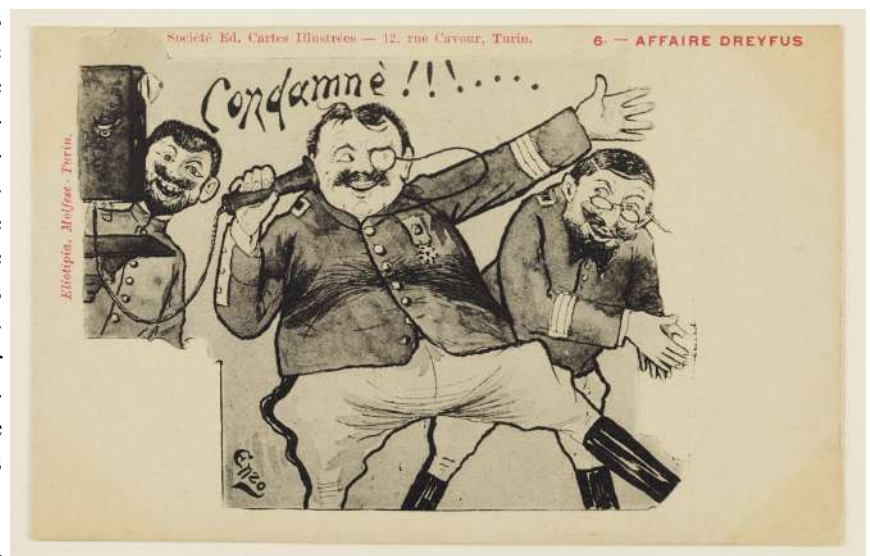
Fonds Dreyfus du Musée de Bretagne. Carte postale. Création Enzo, Illustrateur. Condamnation de 1899.

Le Musée de Bretagne à Rennes possède un fonds exceptionnel de pièces d'archives liées à l'affaire Dreyfus. Dès le procès à Rennes le Musée avait commencé à rassembler des documents et ce fonds a été ensuite considérablement enrichi en 1978 par une donation de Jeanne Lévy, fille du capitaine Dreyfus. Le fonds Dreyfus du Musée de Bretagne rassemble quelques 6 800 pièces dont plusieurs sont reproduites dans le portail « Collections » du Musée.