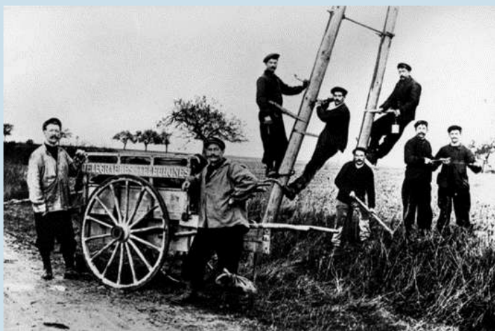
Lignards dans les années 20

Les travaux de co-construction de la future exposition temporaire par le musée des transmissions de Cesson-Sévigné et l'association Armorhistel entrent dès la rentrée dans la phase préparatoire à la mise en place des supports média et des objets présentés selon la scénographie retenue.