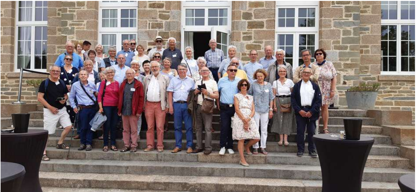
Photo des participants au Château des Pères