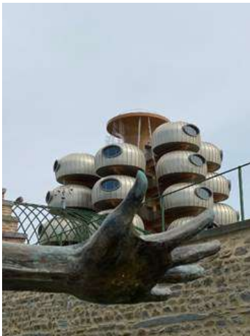
N° 1 (Groupe De Forest)