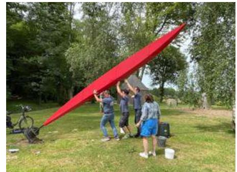
N°3 (Groupe Edison)