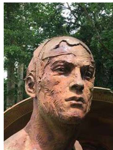
N° 5 (Groupe Bell)