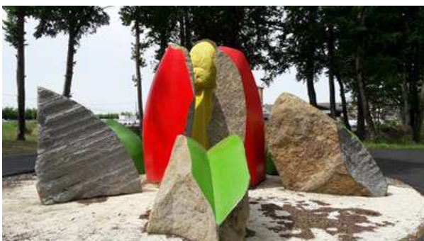
N° 4 (Groupe Edison)