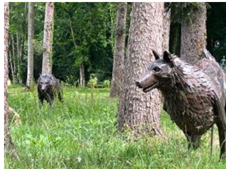
N° 2 (Groupe Bell)