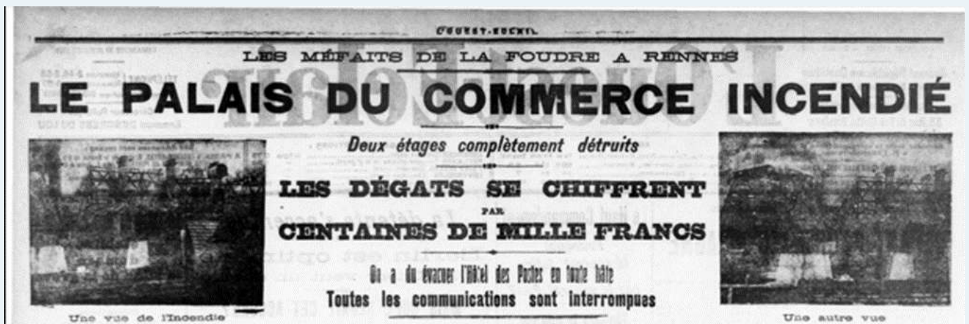
En-tête de l'article de Ouest-France du 30 juillet 1911 après l'incendie qui a détruit en grande partie le Palais du Commerce

Adresse de contact : palaisducommerce@armorhistel.org