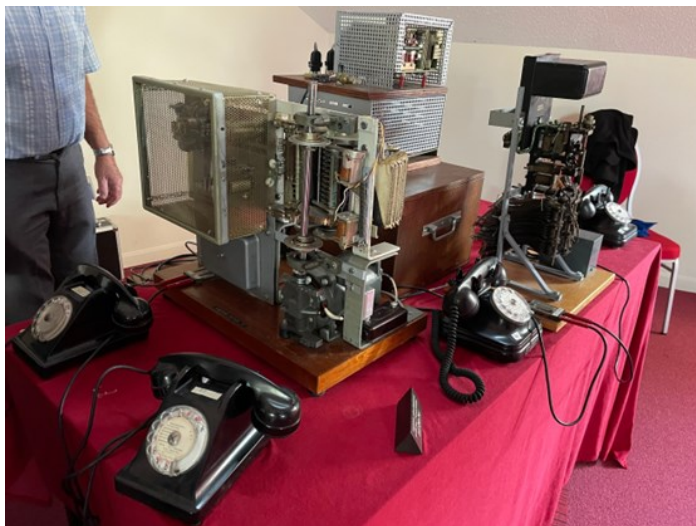
Maquettes Strowger et Rotary de l'association Loristel