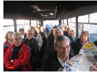
En route pour l'excursion....

Après une traversée paisible, permettant aux uns de finir leur nuit, aux autres de prendre leur petit-déjeuner, nous débarquons à Saint Héliér à 8H45 (heure locale). Un bus, et son chauffeur-guide, un sympathique papy parlant bien français, nous attendait.