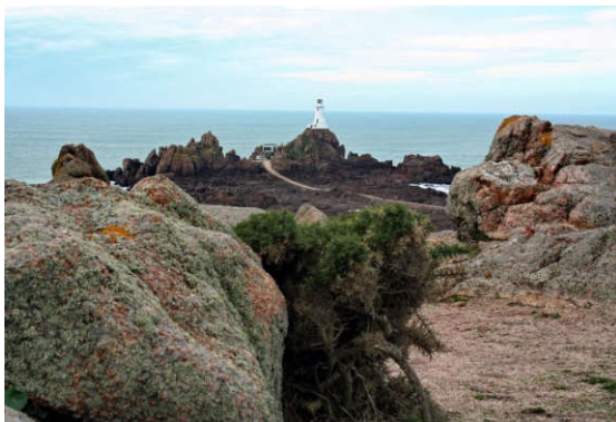
Le phare de Corbière

Quelques arrêts nous permettaient d'apprécier les jolies petites baies avec leurs ports cosmopolites, quelques splendides maisons construites à partir du granit local et la flore de l'île. Jersey donne l'impression, avec ses 700 km de routes, d'être bien plus grande que ses dimensions réelles (14,5 km de long, 8 km de large). L'île est britannique, sans pour autant ressembler à la Grande-Bretagne. Elle a connu un passé français qui se retrouve dans les noms des villages, des lieux touristiques et des panneaux.