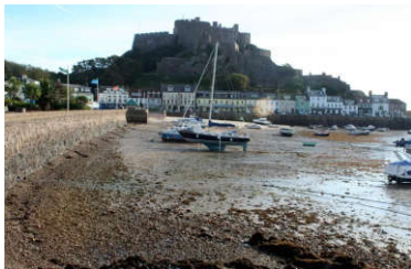
Petit port de Gorey, Mont Orgueil Castle

Après une traversée paisible, permettant aux uns de finir leur nuit, aux autres de prendre leur petit-déjeuner, nous débarquons à Saint Héliér à 8H45 (heure locale). Un bus, et son chauffeur-guide, un sympathique papy parlant bien français, nous attendait.