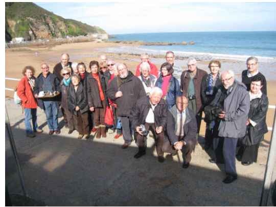
Après le « tea-break » ...

Il était donc temps de partir pour une ballade de 3 heures à la découverte des paroisses de l'île (St Clement, St John, St Ouen, St Breladre, etc ...). Notre papy-chauffeur nous entraînait, à 30 km à l'heure maximum, sur les petites routes jersiaises, au risque à chaque virage de se retrouver nez à nez avec un autre véhicule.