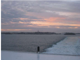
Départ de Saint Malo

Par une belle journée d'automne, véritable journée de printemps, les 28 inscrits se sont retrouvés aux aurores à la gare maritime de Saint Malo pour l'embarquement.