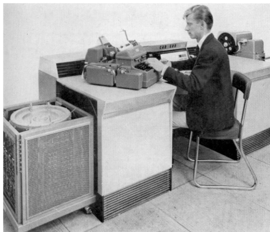
Calculateur SEA CAB 500.

Une exposition a été organisée en septembre dernier à la mairie de Courbevoie pour célébrer l'évènement. Des matériels et des logiciels témoignant de cette aventure y étaient présentés.