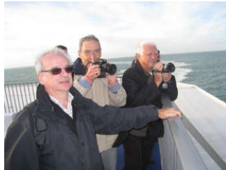
Terre en vue ...