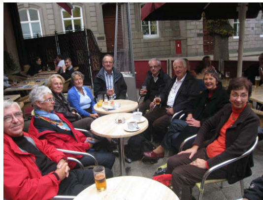
Après l'effort ...

Le programme de l'après-midi fut simple : shopping pour les uns, musées ou visites pour les autres en incluant le « tea-break » ou la « pinte » traditionnels.