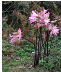
Au détour du chemin, quelques amaryllis