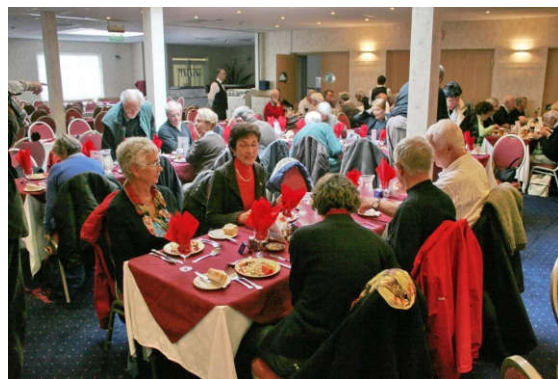
« Time for lunch ... »

12H30, l'heure du déjeuner est arrivée. Nous nous retrouvons dans un restaurant de Saint Héliér pour un repas très « british ».