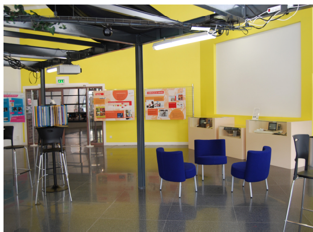
Une vue générale de l'exposition

Du 7 au 16 octobre 2011, plus de 500 personnes ont visité l'exposition à la Cantine numérique rennaise