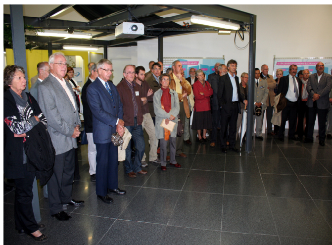
Vue partielle de l'assemblée