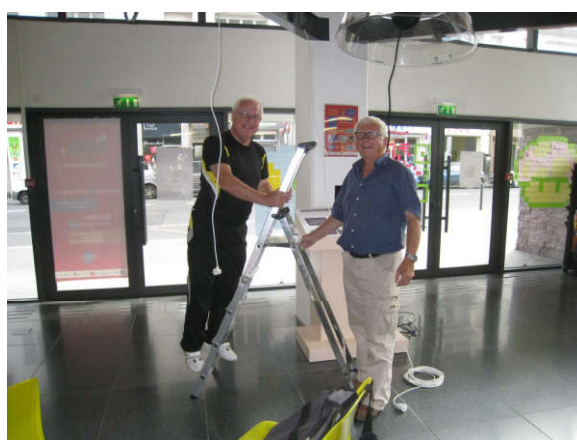
Installation de la parade