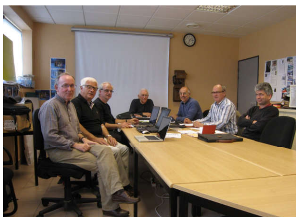
1ère réunion du groupe de conception