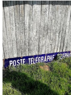
Signalétique dans la Manche