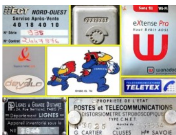
Assemblage de logos