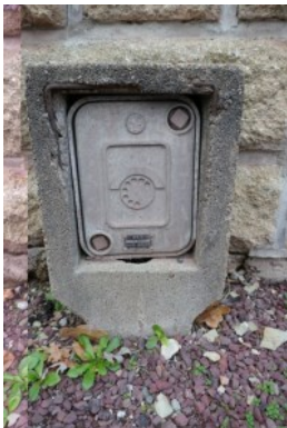
Boîte de raccordement à Chantepie