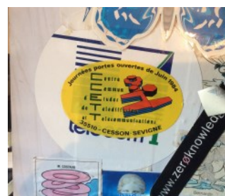
Collages avec 1ères portes ouvertes au CCETT