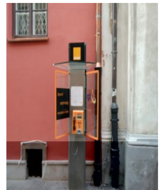
Cabine à Varsovie