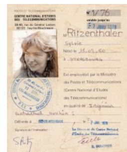
« Ma 1ère carte professionnelle »