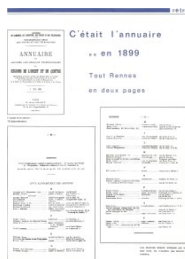
Copie de l'annuaire 1899 de Rennes