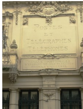
Signalétique de l' Hôtel des Postes de St Servan