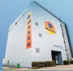
Musée des transmissions - Espace Ferrié

Vous partagez les objectifs de l'association, alors rejoignez nous.